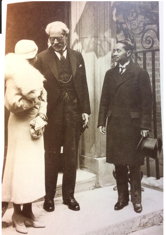
นายกรัฐมนตรีอังกฤษรับเสด็จฯ ที่หน้าทำเนียบ