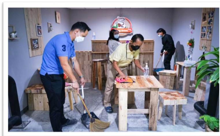
บุคลากรสำนักงานการพิมพ์เข้าร่วมกิจกรรม Big Cleaning Day บริเวณชั้น B๑