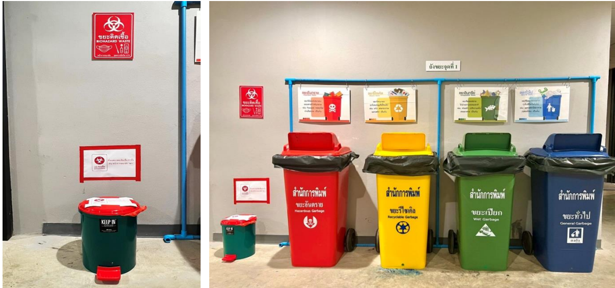
ถังขยะจุดที่ ๒ บริเวณห้องเรียงพิมพ์