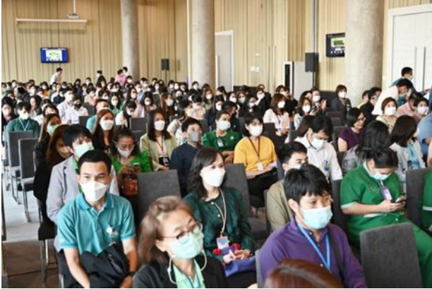
- ภาพบรรยากาศในห้องประชุม