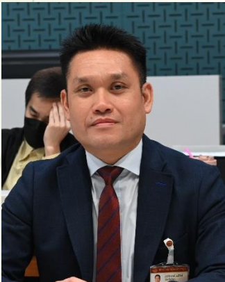
นายรังสรรค์ มณีโรจน์ สมาชิกสภาผู้แทนราษฎร กรรมการกองทุนเพื่อผู้เคยเป็นสมาชิกรัฐสภา